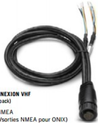
CÂBLE POUR CONNEXION VHF (non fourni dans le pack)

>réf. AS-DUALNMEA (Câble 2 entrées/sorties NMEA pour ONIX)